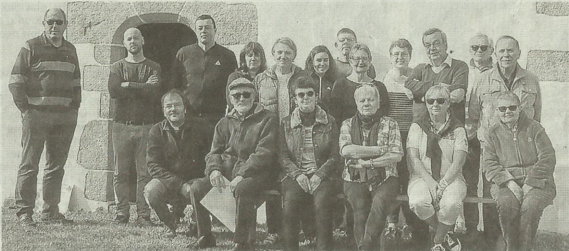
Samedi, ils étaient plus d'une vingtaine à la chapelle Saint-Gilles du Cosquer.

Le premier pas vers la création d'une association a été franchi à Plouharnel. Samedi, ils étaient plus d'une vingtaine à la chapelle Saint-Gilles du Cosquer et des statuts vont être rédigés et être soumis au vote, lors d'une assemblée générale constitutive. Un conseil d'administration, puis un bureau sera alors élu.