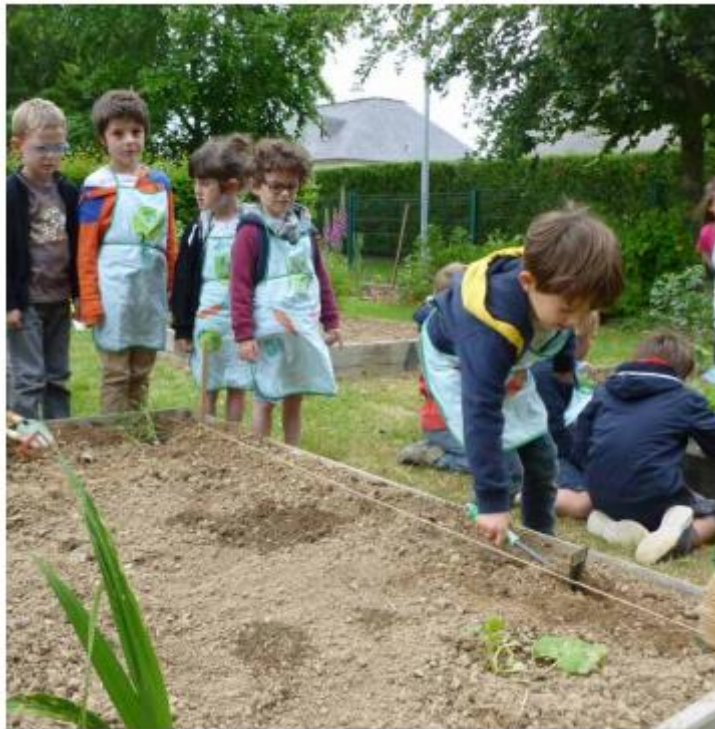
Potager de l'école