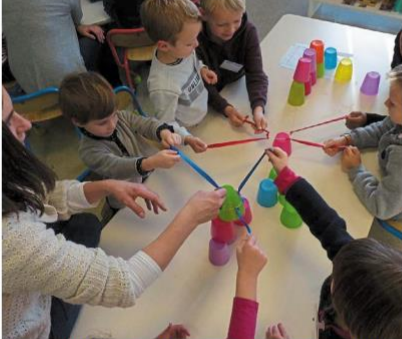
Les élèves de l'école Notre-Dame participent à des ateliers de sensibilisation au handicap.

Vendredi, l'école Notre-Dame organisait sa traditionnelle journée sans cartable. Les enfants de la petite section aux classes CM2 étaient invités à vivre l'école autrement. Trois ateliers sur le thème « Tous ensemble, tous différents » ont été mis en place.