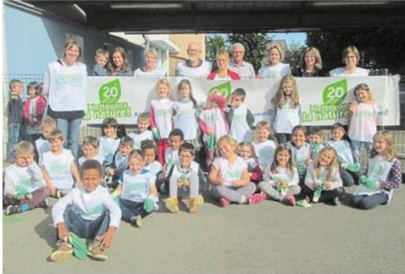
L'école Cesson Notre-Dame participe au tri et au recyclage des déchets.

À l'occasion des 20 ans de l'opération Nettoyons la nature, organisée par le centre Leclerc, quatre classes de l'école Cesson Notre-Dame ont effectué des travaux de nettoyage aux abords et à l'intérieur de l'école. C'était la sixième fois que l'établissement participait à cette opération de sensibilisation au tri et recyclage des déchets.