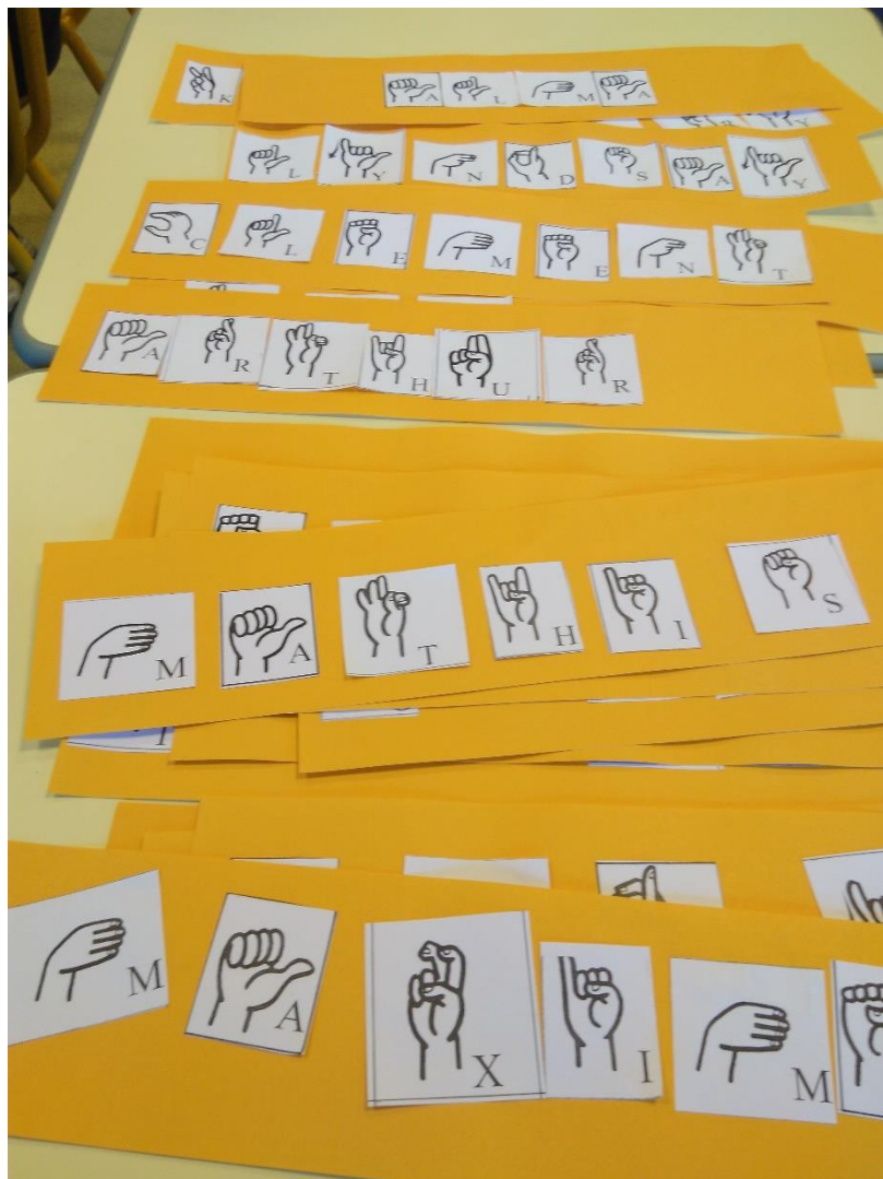
Prénoms en langage des signes – journée sans cartables – 1 er décembre 2018